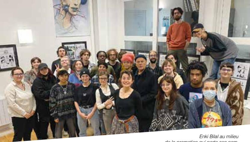
Enki Bilal au milieu de la promotion qui porte son nom.