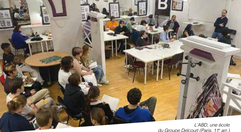
L'ABD, une école du Groupe Delcourt (Paris, 11 e arr.)