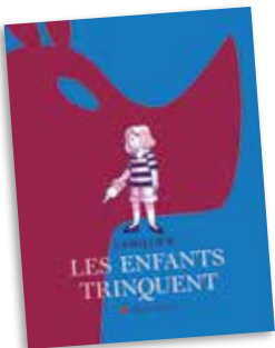
Les Enfants trinquent par Camille K. – Albin Michel – 2020