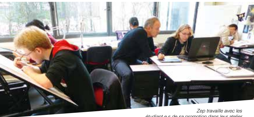
Zep travaille avec les étudiant-e-s de sa promotion dans leur atelier

C'est une exclusivité de l'Académie de Bande Dessinée DELCOURT et un soutien d'exception à sa pédagogie : chaque nouvelle promotion d'étudiant-e-s a le privilège d'être « parrainée » par un auteur ou une autrice de renom.