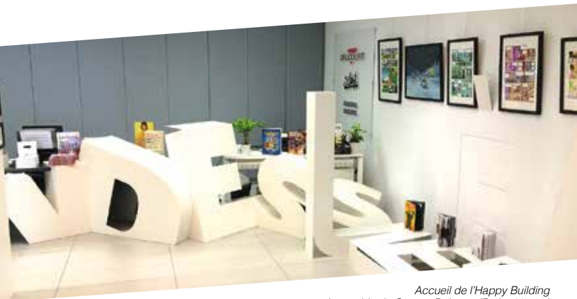
Accueil de l'Happy Building immeuble du Groupe Delcourt (Paris, 11 e arr.)

L'implication du Groupe Delcourt garantit un projet d'excellence tant dans le suivi individuel qu'en matière de perspectives professionnelles pour chaque étudiant-e de l'Académie.